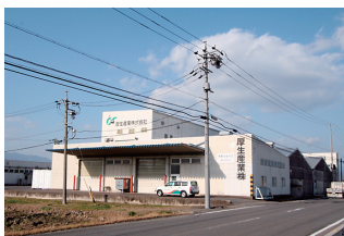
厚生産業(株) 本社工場