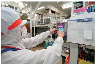
三島食品(株) 広島工場