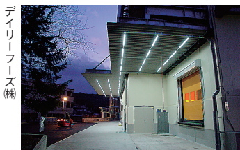
デイリーフーズ(株)

検査機器有効活用法 1 金属検出機 2 X線異物検出装置 (株)インシダ 3 光選別機 (株)サタケ 4 画像式異物除去装置 日立造船(株) 5 マグネットセパレーター(磁力選別機) (株)マグネテックジャパン