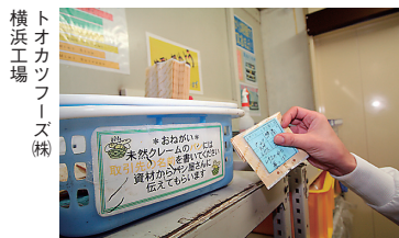
トオカツフーズ(株) 横浜工場