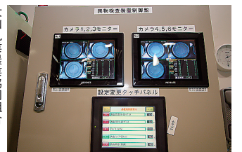
大山乳業農業協同組合