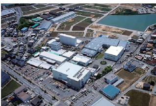
六甲バター(株)稲美工場