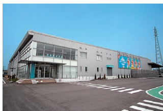
赤城乳業株 本庄千本さくら 「ISO」工場