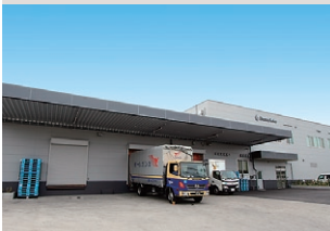
昭和化工(株)福町本社工場