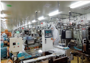
正田フーズ(株)本社工場