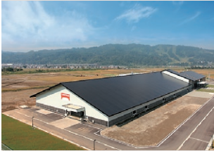
テーブルマーク(株)魚沼水の郷工場