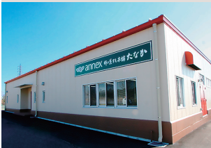
株柿の葉すし本舗たなか 本社工場アネックス