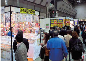
第1回 食品&飲料PB・OEM ビジネスフェア2013の様相