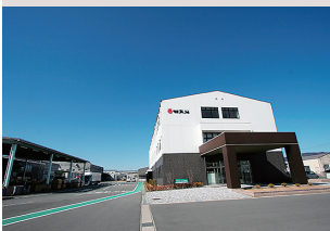
竹本油脂(株) 亀岩工場