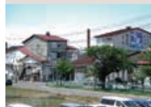
太子食品工業(株)十和田工場