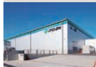
(株)伊藤園 神戸工場

35 [Close Up!] 食品メーカーの品質保証室で誕生した業務支援システム「NEQST」 タカラ食品工業(株)