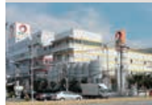
オタフクソース(株)