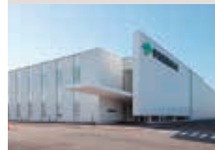
(株)伊藤園関西茶業

35 [Close Up!] 食品メーカーの品質保証室で誕生した業務支援システム「NEQST」 タカラ食品工業(株)