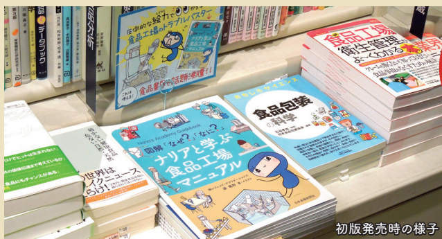
初版発売時の様子

A4変型サイズ、64ページ ISBN978-4-88927-214-7 C3458