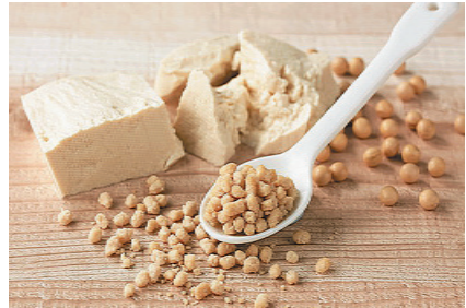
「ソイルプロ そぼろタイプ」