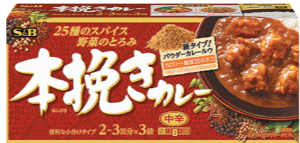
「本挽きカレー(中辛)」