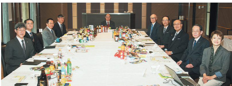
第39回食品ヒット大賞選考委員会

日本食糧新聞社制定、令和2年度「第34回新技術・食品開発賞」受賞商品が決定した。選考委員会が1日、食情報館で開催された。ノミネートされた有力候補を対象に厳正かつ慎重な審査が行われ、受賞商品が決定した。コンスタートやデキストリンなどの固結防止剤を用いた粉末状カレールウの製