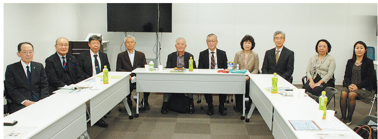
第34回新技術・食品開発賞選考委員会